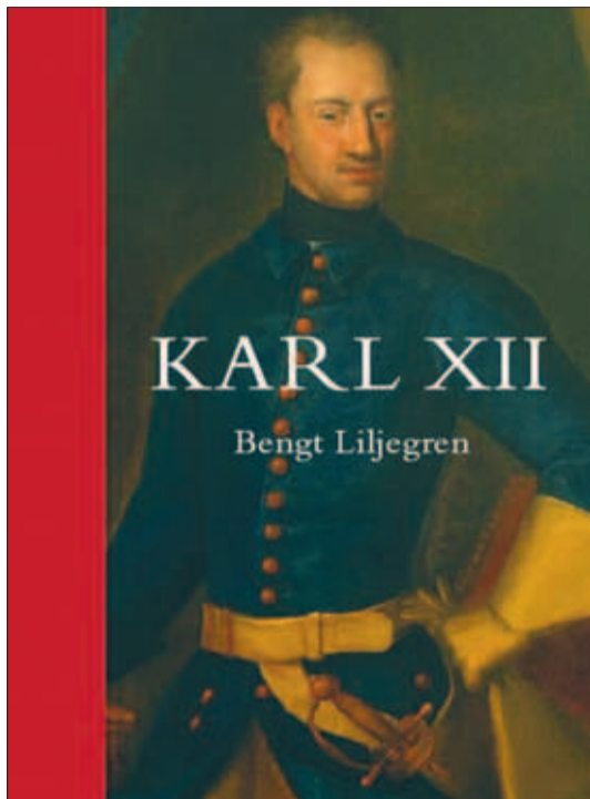
Bengt Liljegren. KARL XII ELULUGU

Nendele küsimustele pole muidugi võimalik lõplikult vastata. Täna võib vaid nentida, et Karli sõja-