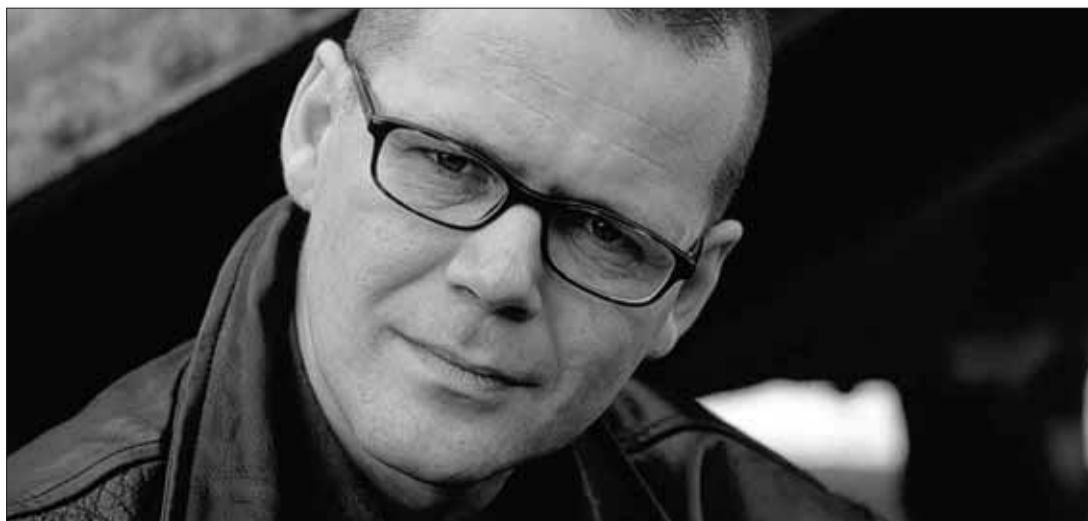
Kari Hotakainen on üks populaarsemaid Soome kirjanikke.

Kari oli hea. Ta rääkis, et kiire laevaga sõitmine on soomlastele liiga napp aeg, sest siis jõuab juua ainult 12 toopi. Et reklaamiagentuuris töötamine erines te-