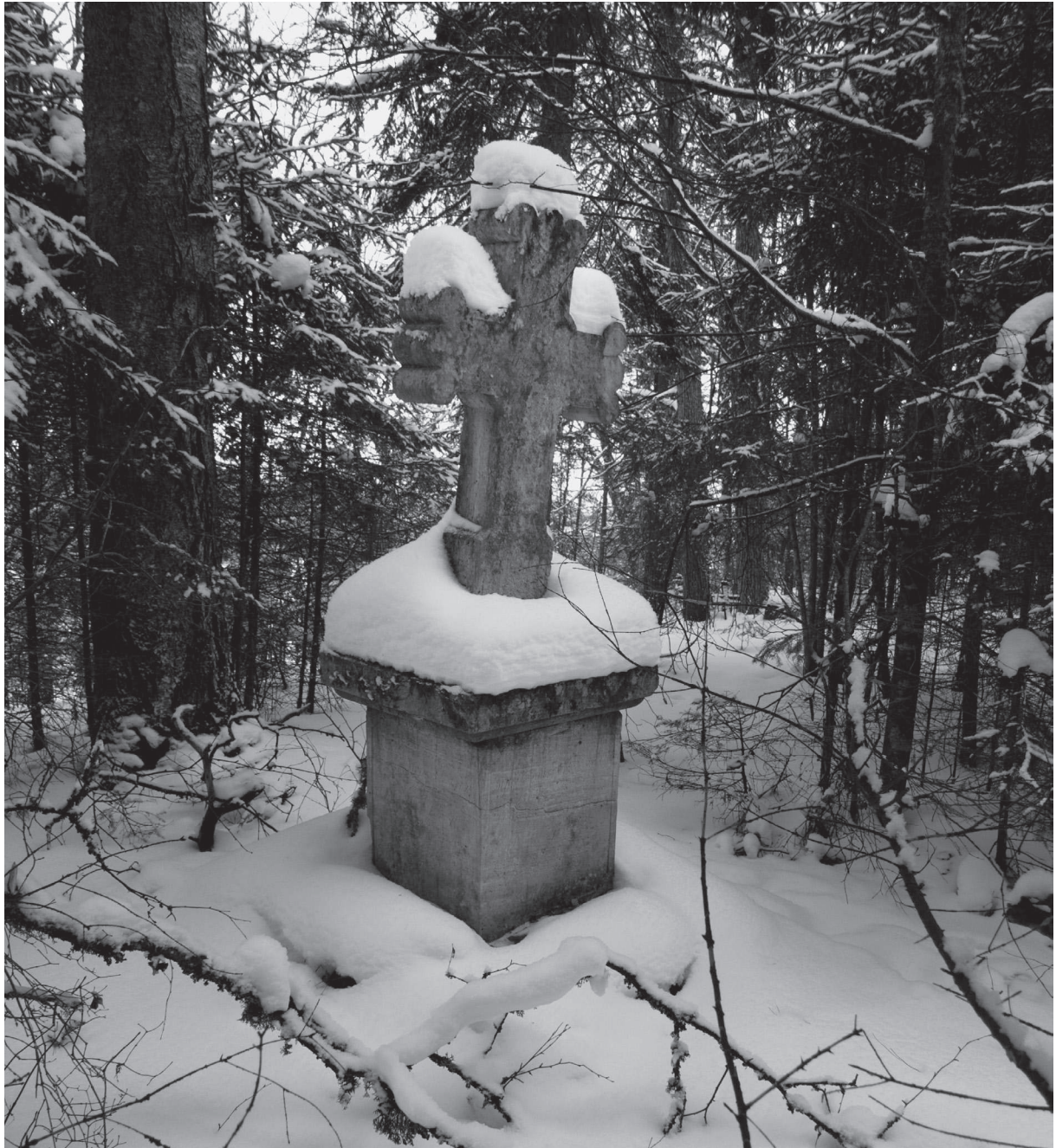
19. sajandil koos lähedalasuva kirikuga rajatud Kastolatsi surnuaed Otepää lähistel.