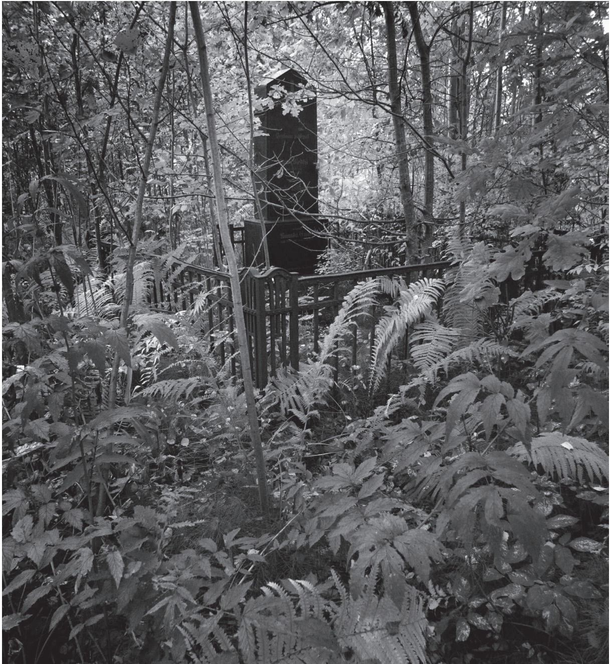
Tallinna Siselinna kalmistu metsistunud lõunanurk.