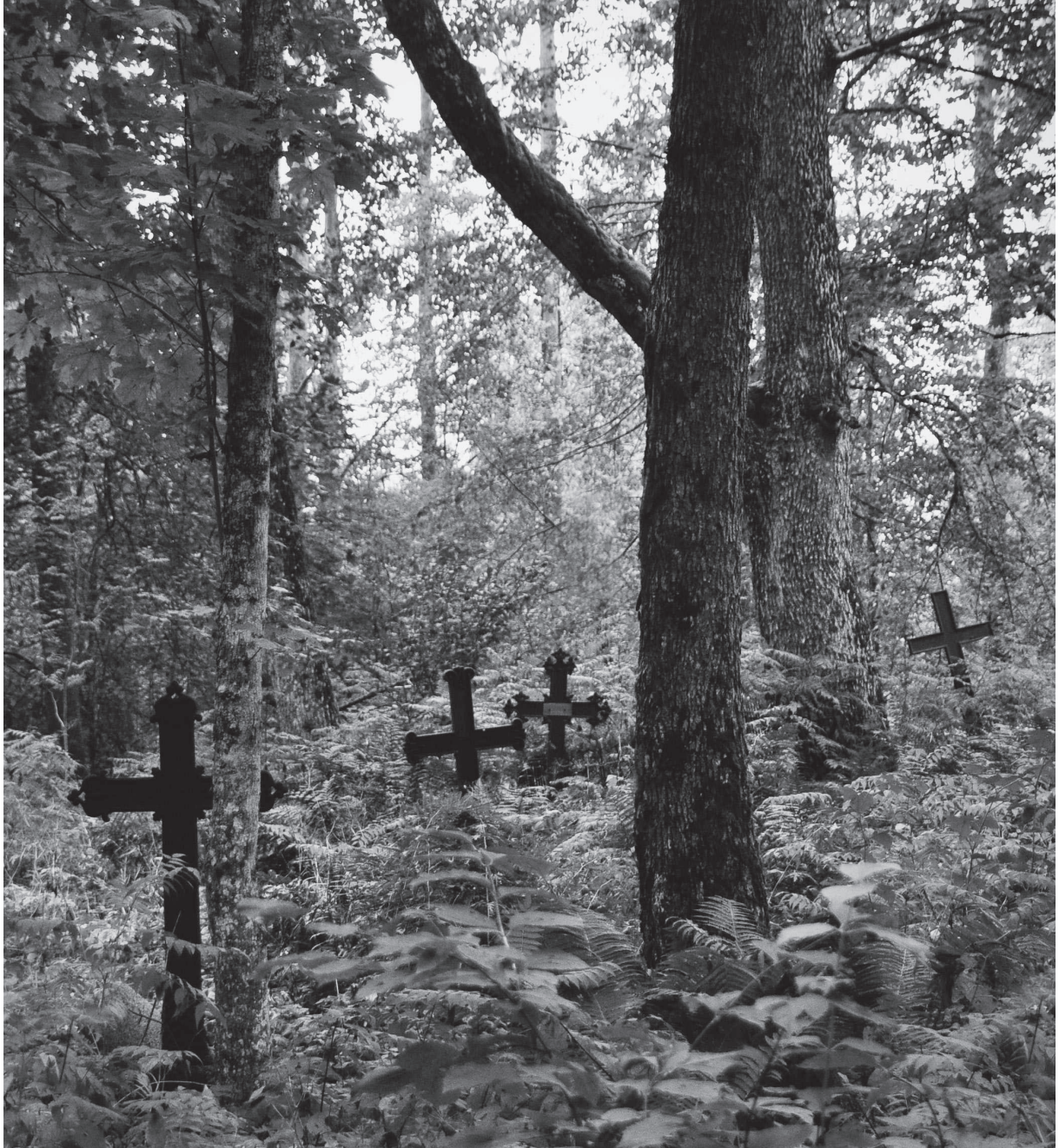
Malmristid Lüllemäe vanal kalmistul, rajatud 1812. aastal.