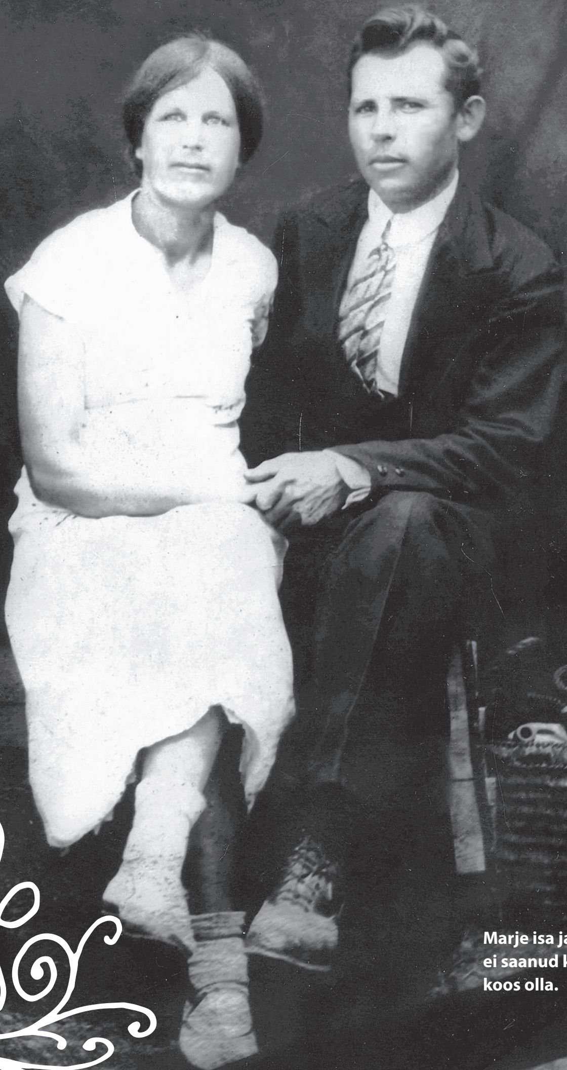
Marje isa ja ema ei saanud kaua koos olla.