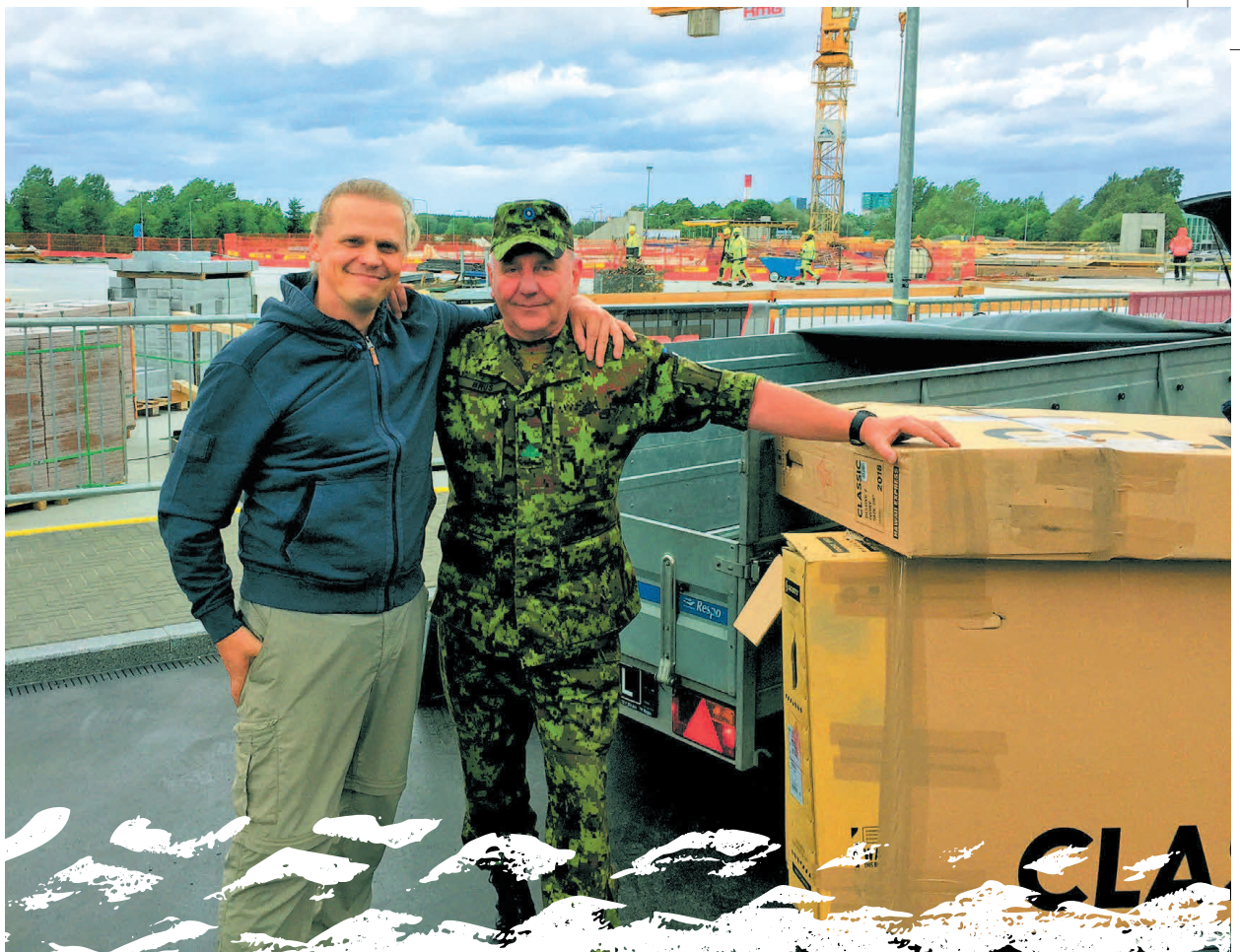
Juba heaks traditsiooniks saanud pilt lahkumisest Tallinna lennujaamas