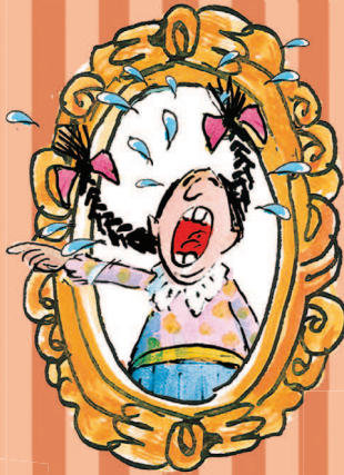
Tõina-TIINA lk 33