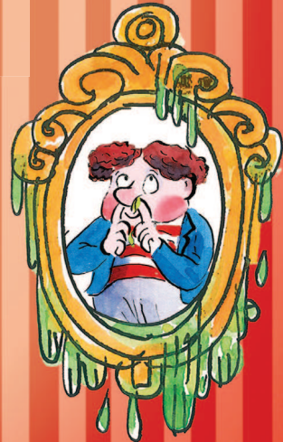
NORMAN Nina- nökkija lk 115