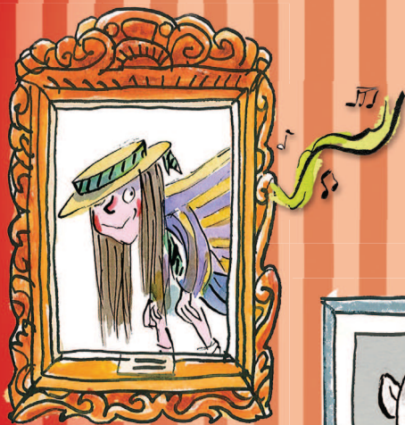
Pussu-PAULA lk 179