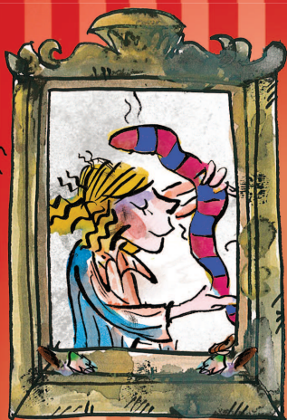
Räpa-RITA lk 135