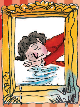
Ilalõug IVAN lk 15