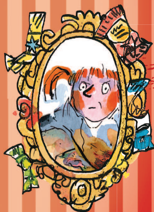
Sohva-SOFIA lk 241