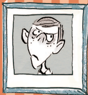
Tõsine THEODOR lk 209