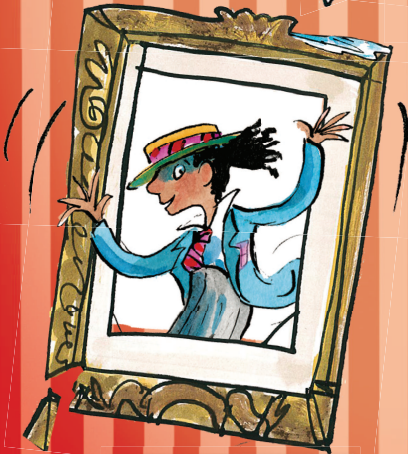
SÄSIL Säbeleja lk 81