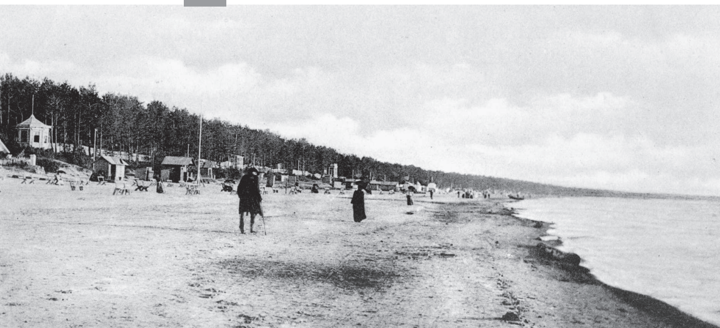
Narva-Jõesuu rand. 19. saj lõpp. Foto. AM F 18830:109, Eesti Ajaloomuuseum SA.

Vene Keisririigi ametlikuks kuurordiks kuulutamise käis supellinnas tavaliselt kaasas kuurordikomisjoni loomine ja supelinspektori ametisse nimetamine. Ühtlasi hakati suvitajaid registreerima, mis võimaldas teha statistikat ja koguda makse. Puhkamine ei olnud tasuta – makse koguti nii sissesõitnutelt, majutajatelt kui ka ettevõtete omanikelt. Suvitusmaks polnud kehtestatud siiski kõigis kuurortides.