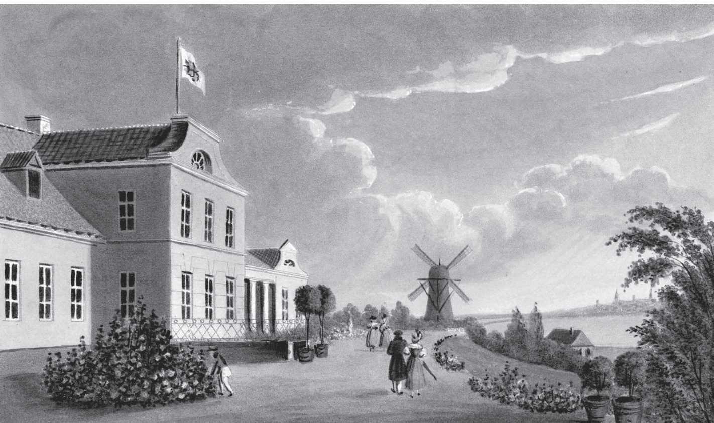
Viimsi loss. 1833. Koloreeritud akvatinta. Autor: Theodor Gehlhaar. TLM 228:5 G 285, Tallinna Linnamuuseum.

Väljasõidud-jalutuskäigud mere äärde, õhuvannid ja tervistavad suplused meres muutusid jõudeelu lahutamatuks osaks eriti pärast Napoleoni sõjakäigu lõppu. Vähetähtis polnud ka asjaolu, et „kaitsmaks oma alamaid halbade lääne poliitiliste mõjude eest“, keelas Vene isevalitseja neil 1820. aastatel Kesk-Euroopasse reisida. Edasi polnudki muud tarvis, kui siia jõuaks mõni keiserlik või suurvürstlik kuulsus ja Eesti esimene kuurort Reval võiski sündida.