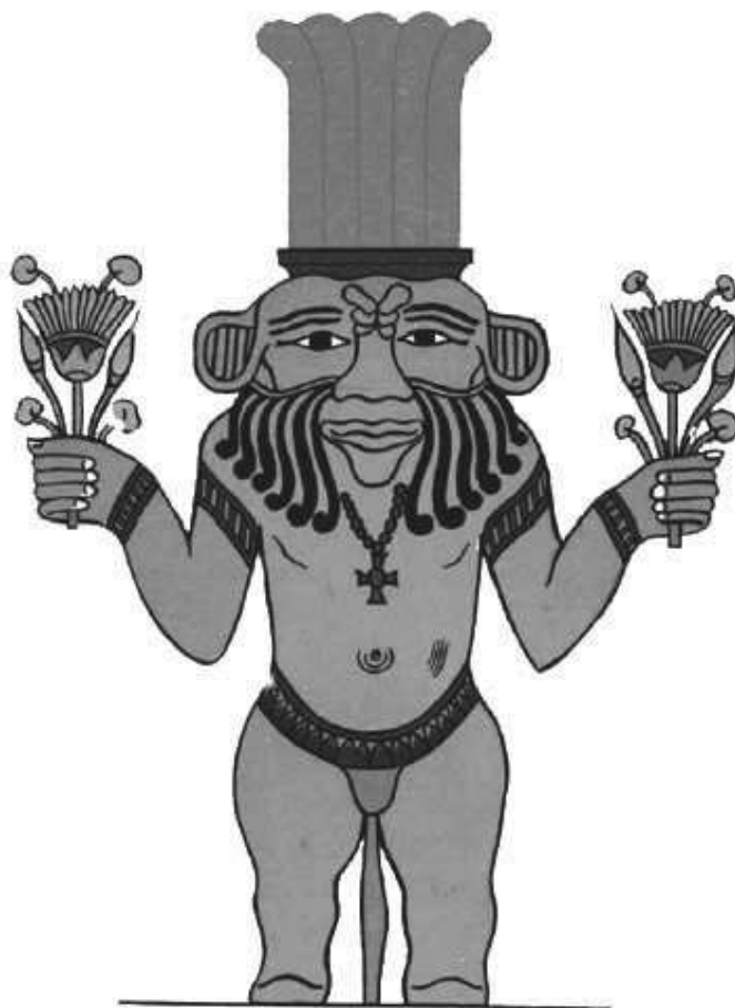
JUMAL BES, KODU KAITSJA.

Weret asetab mõlemad kujud kohtadele, kust nad sündi pealt näeksid, et nende mõju suurendada. Kui Merit mitme kuu eest rasedusest teada sai, andis tädi talle sinistest Tawereti-kujulistest amulettidest kaelakee. Bes ja Heqet on küll näotud, aga Tawereti kokkuklopsitud välimus näib veelgi inetum. See seisva tiine jõehobu kujuga, lõvi käppade ja krokodillilaadse seljaga jumal on kolmest kaitsvast jumalast kõige raevukam ja suudab loodetavasti kõik kurjad jõud tagasi tõrjuda. Kolmik on küll eemaletõukav, aga lohutab oma kaitsealuseid.