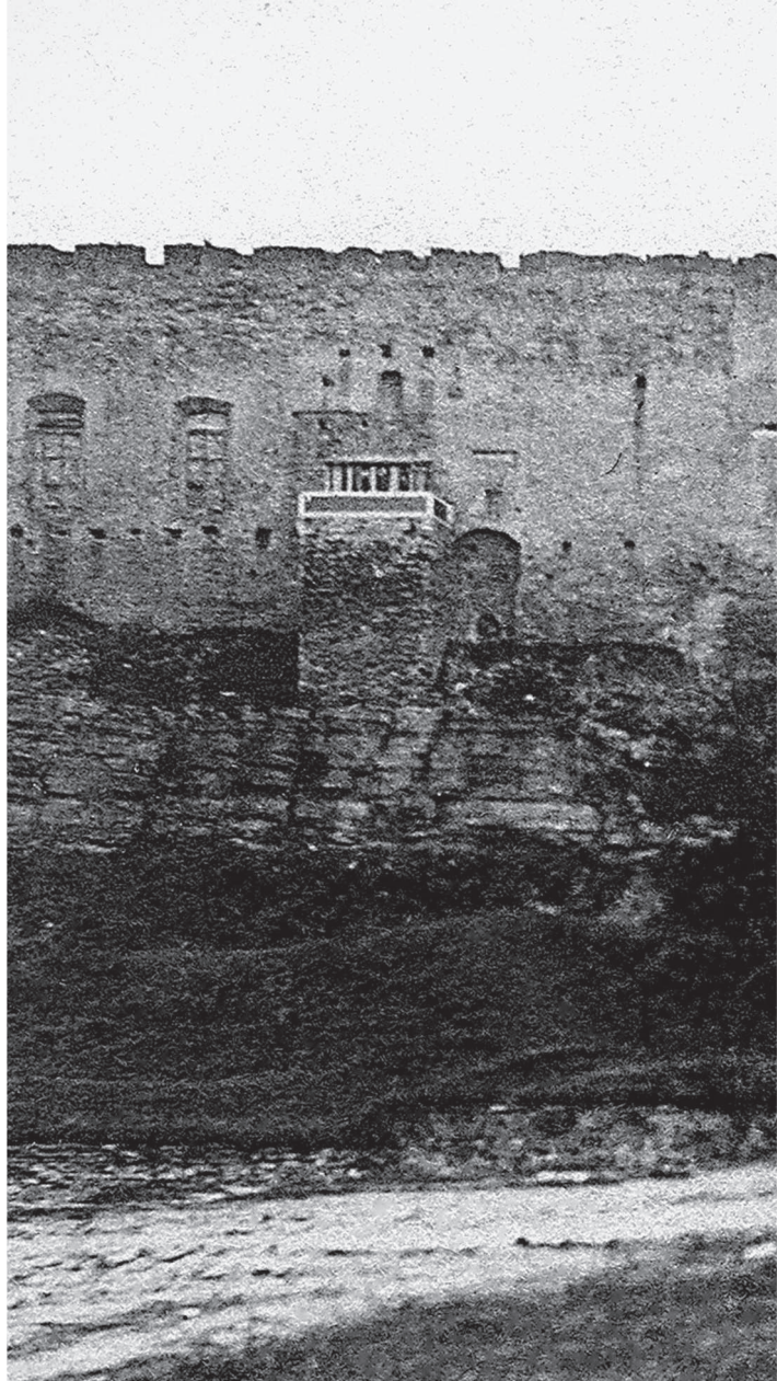
Vaade Toompea lossile ja Falgi teele Toompuiestee poolt 1850. aastate II poolel, pärast Falgi tee rajamist 1856. aasta novembris. Stereofoto, albumiinfoto 8,4 × 17,5 cm. TLM F 2102