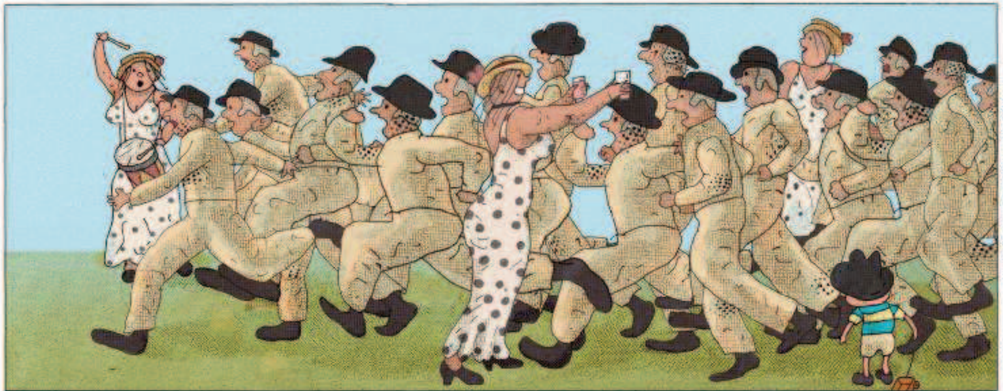
Kolmapäeval, täpselt kell 12 hakkab lööma Kilpla tornikell, andes teada igapäevasest mõttevahetuspausist. Kilplased jäätavad oma tööd sinnapaika ja lähevad jooksujalu.