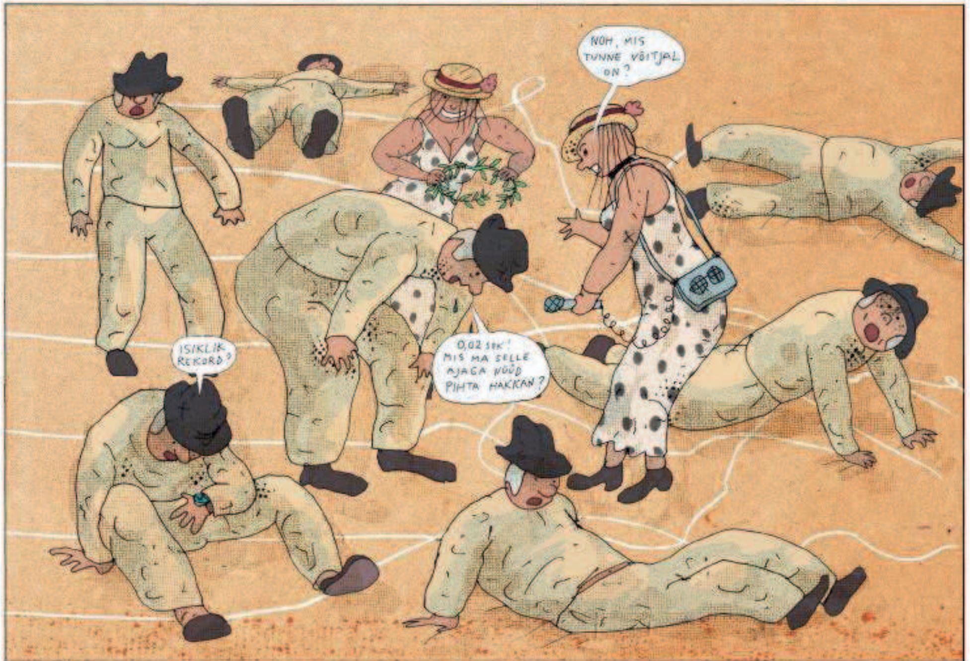
Võitja edestab järgnevat tervelt 0,02 sekundiga. Seda edumaad ei tohi käest anda!